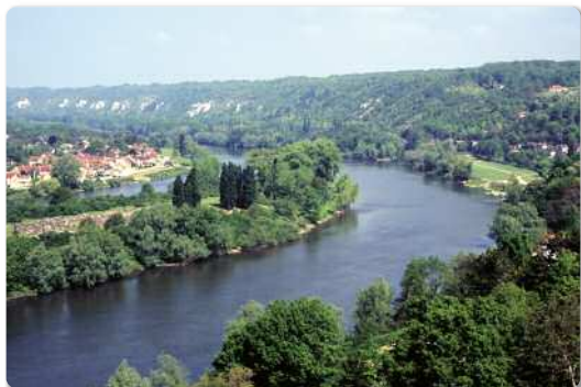
Les méandres de la Seine à Vetheuil (95).

Une partie de ce patrimoine des grandes entités paysagères est reconnue de diverses façons : sites classés et inscrits au titre de la loi de 1930, parcs naturels régionaux, paysages urbains (secteurs sauvegardés, ZPPAUP), mais aussi sites protégés au titre du patrimoine