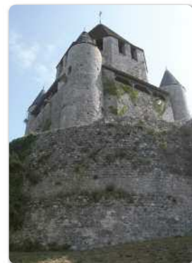
La Tour César, donjon médiéval, à Provins (77).

Quatre sites franciliens sont inscrits par l'Unesco sur la liste du patrimoine mondial : le palais et le parc de Versailles, le palais et le parc de Fontainebleau (le massif forestier de Fontainebleau est quant à lui classé en réserve de biosphère), Paris et les quais de la Seine, Provins. Le patrimoine participe fortement à l'identité et au rayonnement de l'Île-de-France, pour en faire la première région touristique mondiale. C'est un élément appréciable du cadre et de la qualité de vie, et aussi de l'identité des territoires et de l'enracinement des populations. Associé au tourisme et à la politique culturelle, ce patrimoine représente pour la région une précieuse ressource et un gisement d'emplois.