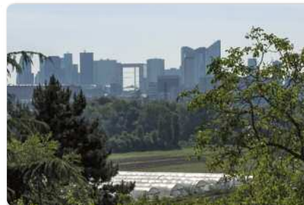
Le quartier d'affaires de La Défense et les serres d'une enclave agricole à Carrières-sur-Seine (92).