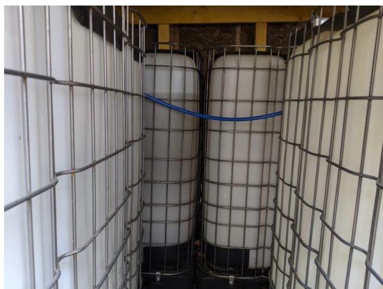
Cuves de stockage de l'urine

L'urine est gérée par une entreprise de location et installation de toilettes sèches, Toilettes & Co, qui a des capacités importantes de transport et stockage et traitement d'excréments humains. Les cuves d'urine ont été gérées comme le reste des matières collectées par l'entreprise, dans une de leur plateforme de compostage située dans la région de Poitiers.