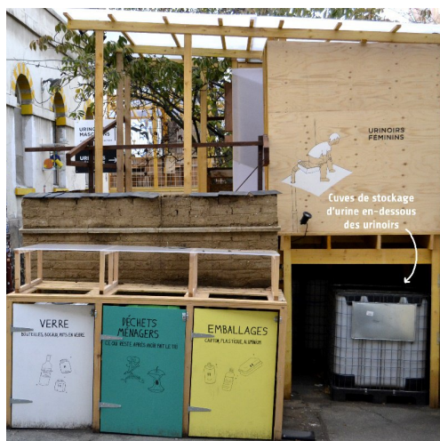
Cuves de stockage de l'urine sous les urinoirs.