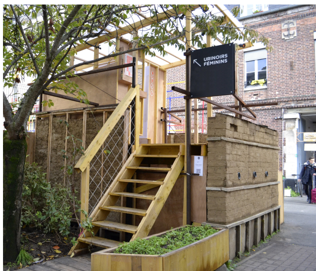
Entrée vers les urinoirs féminins

Chaque urinoir est masqué par des paravents mais ne comporte pas de porte. Ils s'utilisent dos à l'urinoir, sans s'asseoir. Cela correspond, pour la plupart des femmes, à la position habituelle adoptée pour uriner sans s'asseoir dans les toilettes publiques. Les urinoirs sont sans eau, ce qui permet de collecter l'urine sans la diluer et sans augmenter le volume à collecter. Le papier toilette doit en revanche être mis dans une poubelle et non dans l'urinoir. Un siphon sec sous l'urinoir permet d'empêcher les remontées d'odeurs.