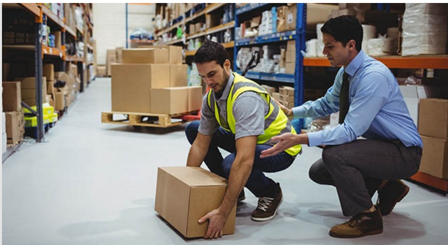
Tableau de bord de la santé au travail en Île-de-France

Dans le cadre du troisième plan régional santé au travail en Île-de-France (2016-2020) la Direction régionale des entreprises et de la concurrence, de la consommation, du travail et de l'emploi (Direccte) a saisi l'Observatoire de santé d'Île-de-France (ORS, département de L'Institut) pour la réalisation collaborative d'un tableau de bord régional des données en santé et sécurité au travail. Ce tableau de bord intéresse l'ensemble des acteurs régionaux intervenant dans la prévention des risques professionnels. Il rassemble différentes sources de données et en présente une vue d'ensemble, qui dresse un état des lieux de la situation de la santé au travail en Île-de-France.