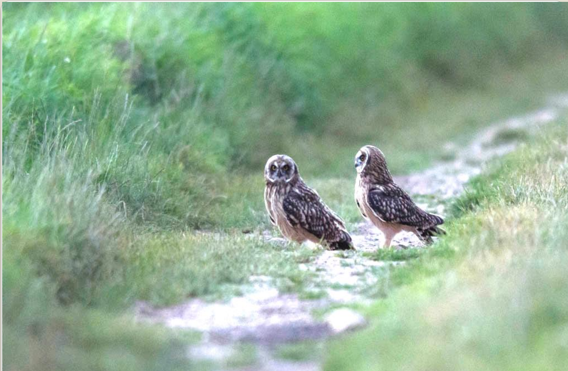
Jeunes Hiboux des marais en 2012 (sud-Yvelines).