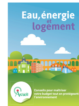
Guide Eau, énergie et logement d'Arcueil

Les personnes souhaitant être accompagnées (au nombre de 15 en 2015-2016) ont ensuite bénéficié de plusieurs visites des conseillers de La Bouilloire: diagnostic socio-technique destiné à identifier les économies potentielles, d'installer les équipements économes en accompagner leur utilisation. La mission s'est étalée sur 8 mois afin d'avoir plusieurs relevés de compteurs. Le bilan est positif, notamment sur les économies d'eau et les bénéficiaires ont apprécié le dispositif.