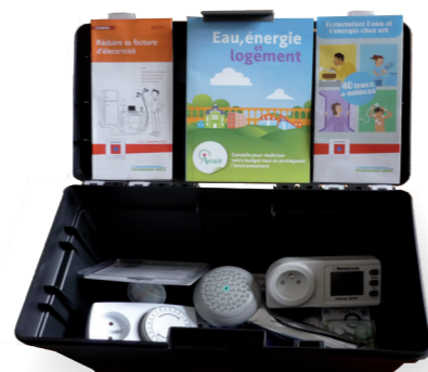
Malette visite à domicile