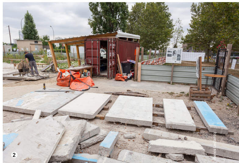
1 et 2. La Fabrique du Clos, plateforme d'expérimentation et de réemploi réalisée par Seine-Saint-Denis Habitat et gérée par Bellastock, au sein du projet de renouvellement urbain du Clos Saint-Lazare, à Stains (93).

Par exemple, la loi du 10 février 2020 relative à la lutte contre le gaspillage et à l'économie circulaire rend obligatoire, à partir du 1 er juillet 2021, le diagnostic « produits, matériaux et déchets » pour les démolitions ou les réhabilitations de plus de 1 000 m 2 de surface de plancher cumulée. Une filière « responsabilité élargie des producteurs » (REP) pour le secteur du bâtiment et des travaux publics (BTP) sera instituée à partir du 1 er janvier 2022, obligeant le producteur à mettre en place un tri à la source, c'est-à-dire à séparer les différents déchets pour les orienter vers les filières de valorisation appropriées. De même, l'augmentation continue de la taxe générale sur les activités polluantes (TGAP), entre 2021 et 2025, pénalisera plus fortement l'enfouissement des déchets – une pratique courante – et incitera les producteurs à privilégier la prévention, puis la valorisation des matériaux sous différentes formes (réemploi, réutilisation, recyclage...).