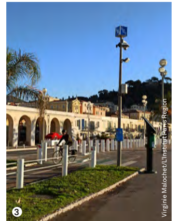
Virginie Maloche/L'Institut Paris Region