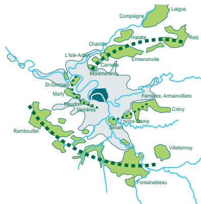
Structure concentrique des couronnes forestières (d'après J. Sgard op. cit.).

Les tracés structurants sont des axes révélant l'histoire ou la géographie des territoires qu'ils traversent et qu'ils ont contribué à façonner : anciennes voies romaines ou chemins médiévaux, grandes voies rectilignes ordonnées par Colbert ou par Napoléon, grandes avenues parisiennes. Ces axes renforcent l'organisation radioconcentrique de l'Île-de-France, contribuant à sa lisibilité. Leurs carrefours sont des repères à l'échelle de la région (Christ de Saclay, Pompadour, Patte-d'Oie d'Herblay...).