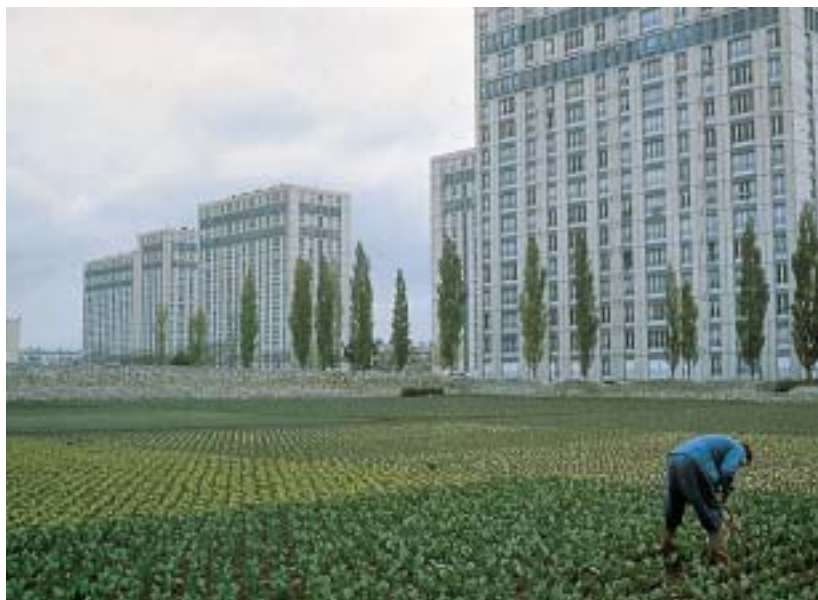
Front urbain abrupt au nord de l'agglomération parisienne.

Il existe de nombreuses autres «situations critiques», comme les lisières forestières grignotées par l'urbanisation, les espaces agricoles fragilisés au contact du bâti, les activités polluantes rejetées aux confins de la ville... Ces franges sont des transitions dans l'espace, mais aussi dans le temps. Ce sont des lieux particulièrement instables, toujours en transformation : progression du front urbain, recul de l'agriculture, apparition et disparition de divers usages du sol (friches, activités précaires, commerces...). Cette instabilité les rend vulnérables, mais aussi précieux car divers et non figés. Chacun de ces sites représente un projet potentiel.