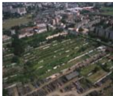
Montreuil (93) - Secteur des murs à pêches.

Ils constituent des points de repère dans le paysage : ce sont des monuments, des bâtiments, de grands ouvrages d'art (tour Eiffel, aéroports de Roissy, tour Pleyel, centrale de Porcheville, «camemberts» de Marne-la-Vallée), mais aussi des points singuliers de la géographie (l'éperon de Chalifert, la falaise de la Roche-Guyon ou le Mont Valérien), parfois les deux (Montmartre). Certains sont en même temps des points de vue qui ordonnent tout un site (terrasses de Meudon, tour de Montlhéry). Ces repères ne doivent pas être traités isolément, mais en relation avec leur environnement.