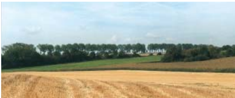
Plantations d'alignement le long de la nationale 19.

Les paysages d'Île-de-France dans l'espace et le temps