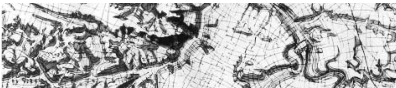
Principales directions de la trame foncière.

l'espace régional : la Beauce, la Brie, la Plaine de France et le Vexin, chacune dominant la précédente de 30 à 100 mètres. Le relief d'Île-de-France et l'occupation du sol qui l'accompagne apparaissent sur le terrain grâce à la forme très lisible des ensembles : plateau agricole, coteau boisé, vallée. Le relief est découpé par un système hydrographique très riche. Les vallées, plus ou moins étroites et profondes, renferment des cours d'eau qui sont autant d'occasions de créer des promenades au fil de l'eau. Les espaces agricoles couvrent encore la moitié de l'Île-de-France. L'agriculture, une des plus productives de France, permet de maintenir des espaces de respiration, mais aussi de loisirs. Très fréquentées par les Franciliens et d'une grande richesse écologique, les forêts font partie de la grande structure de l'Île-de-France et de son patrimoine.