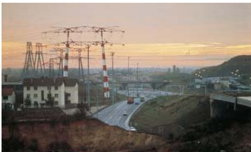
Le croisement de réseaux lourds : autoroute A10, lignes à très haute tension.

Certains boisements sont fragilisés par les implantations urbaines qui les entourent. Leurs lisières sont rendues inaccessibles ou sont grignotées par les parcelles bâties. Leur biodiversité et la variété de leurs ambiances paysagères sont réduites par une fréquentation trop forte et par le morcellement. Bien que les forêts soient globalement protégées par leur statut domaniale, régional ou communal, elles restent fragiles : il peut suffire de l'abattage d'un pan de forêt par une tempête pour que les élus locaux y voient une nouvelle réserve urbanisable. Le SDRIF de 1994 avait prévu une protection des lisières forestières par une bande inconstructible de 50 mètres, mais celle-ci s'est révélée insuffisante.