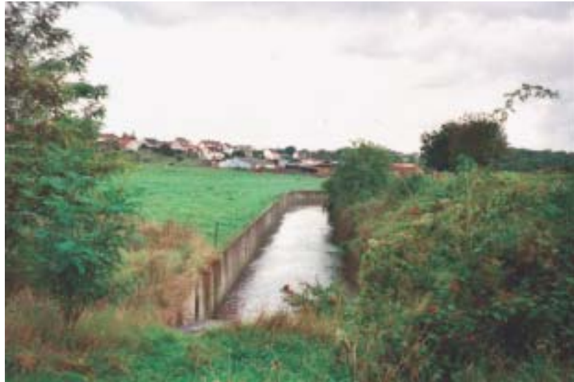
Le Petit Rosne à Sarcelles (95).

En effet, il n'y a pas d'un côté des sites préservés, où la grande structure décrite ci-dessus serait encore lisible, et de l'autre des sites dégradés, où elle serait effacée. L'opposition se situe davantage entre d'une part la stabilité de la «grande structure» – le socle per-