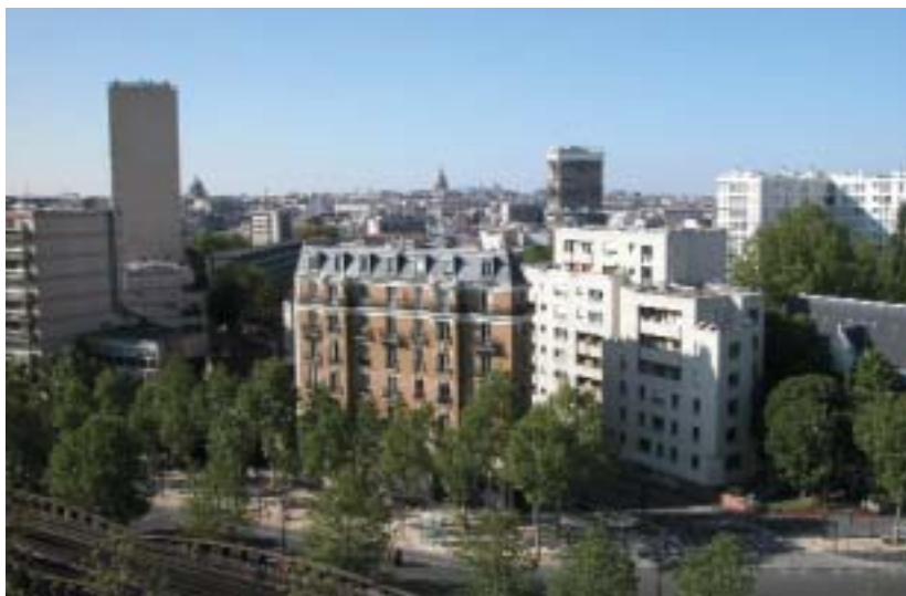
Habitat continu haut aligné sur rue dans Paris.