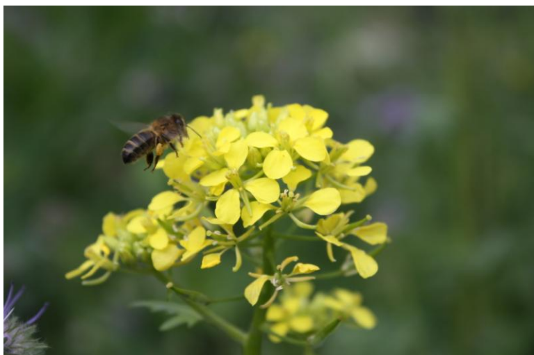
Abeille domestique Jardin partagé Paris 20ème.